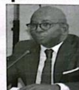
Moustapha Guirassy, ministre de l'Éducation nationale.

de points d'eau. Une situation qui, dit-il, « rend la vie des enseignants difficile dans certaines zones ». Le ministre de l'Éducation nationale a enfin exhorté les collectivités locales à plus d'efforts et d'innovation pour prendre en charge certains problèmes de l'école. « Au-delà des budgets de l'État, les collectivités ont la possibilité de mener des partenariats avec la coopération internationale et des hommes volés pour faire face à certaines lacunes dans les écoles », a-t-il plaidé. M. Guirassy a cité, à ce sujet, l'exemple du « daara » de Coki entièrement pris en charge par d'anciens prisonniers. Il invite les acteurs du système éducatif à assurer une éducation réconciliée avec les valeurs. Seul gage d'une société équitable.