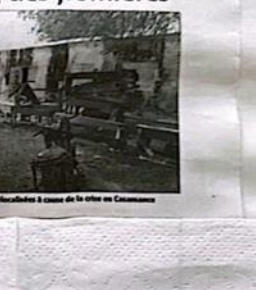
Des écoles qui ont dû fermer à cause du conflit armé en Casamance (Photo l'Archives).

« Si nous ne nous sommes pas mis à profit pour « déhabiller, désinfecter, désinfecter », sortir les enfants de classe et réhabiliter le mobilier afin d'offrir une rentrée dans de bonnes conditions optimales. »