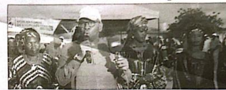
À Taredji, le ministre de l'Éducation nationale a réitéré l'engagement de l'État à renforcer les initiatives en matière d'alphabétisation.

L'analphabétisme ou la non-scolarisation, dit-il, demeure une réalité quotidienne, pénalisant de nombreux concitoyens, en parti-